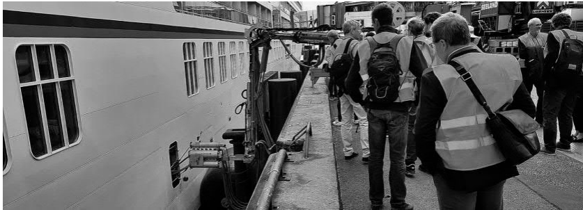
Besichtigung der Landstromanlage Altona